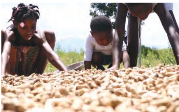
Antwan aprann plante pistach epi fè manba.

Mezire: Nou sèvi ak divès zouti ak enstriman pou mezire diferan bagay (pa. egz. règ gradye, santimèt, pèz, eks.)