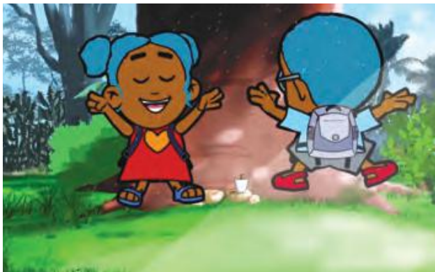
Lili ak Tilou plante yon grenn pwa.

Fotosentèz: se non pwosesis lè plant yo itilize enèji solèy la, dlo ak lè pou yo viv ak grandi.