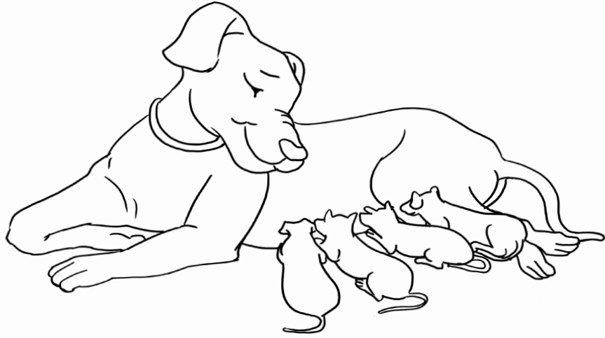
Manman chen an gen 4 ti chen.